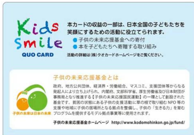
【専用カードケース（中面）の説明文】