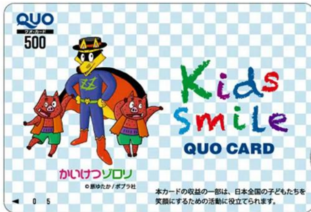
【寄付付きQUOカードデザイン】