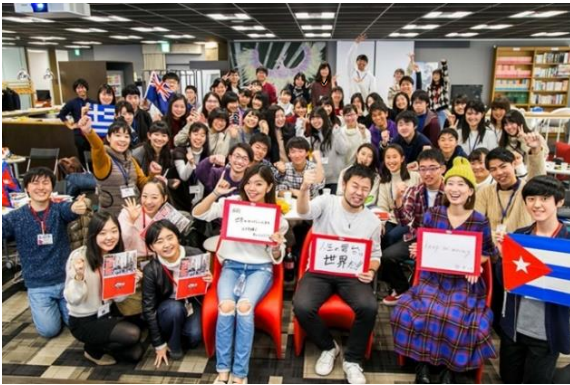
『#せかい部 公式オフ会』東京開催時の様子